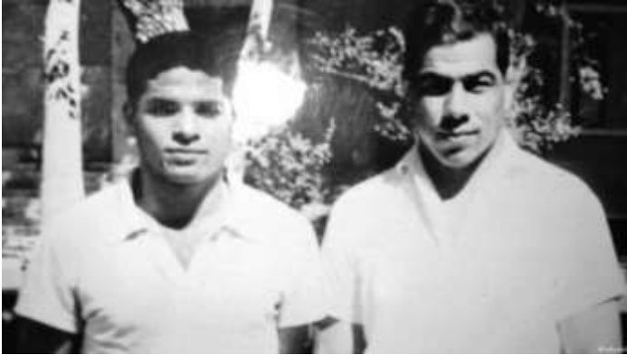
پرویز قلیچ‌خانی و غلامرضا تختی در کنار هم

او که از خانواده‌ای کارگری و فقیر برخاسته بود، بعدها گفته بود که از کودکی با فقر و بی‌عدالتی آشنا بوده و همین تجربه‌ها در شکل‌گیری نگاه سیاسی‌اش نقش داشته‌اند. او همچنین از تاثیر جهان‌پهلوان تختی بر نگاه اجتماعی و انسانی خود سخن گفته بود.