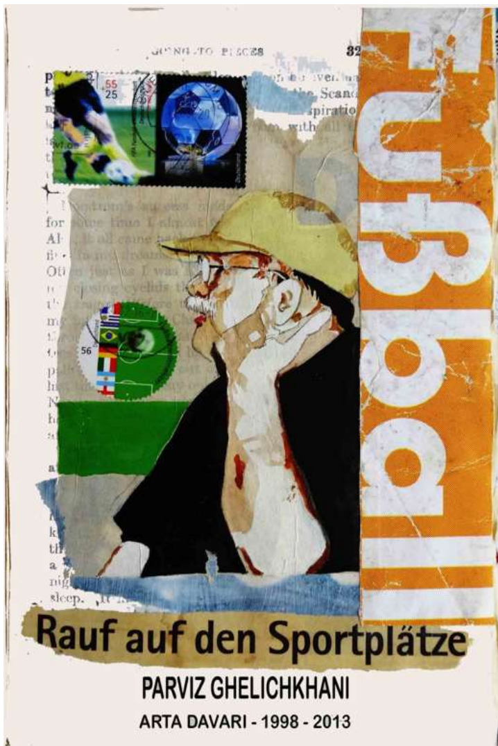
پرویز قلیچ‌خانی: اثر آرتا داوری