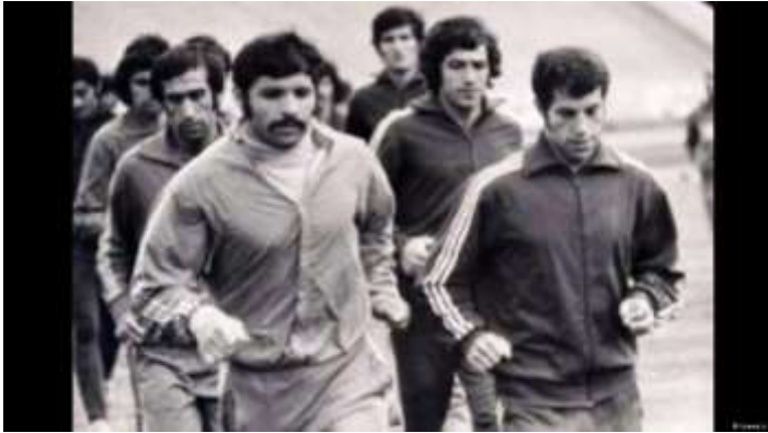
پرویز قلیچ‌خانی، علی پروین و علی جباری از پیشکسوتان فوتبال ایران در حال تمرین عکس

با این حال، ویژگی‌های خاص او باعث می‌شد بیشتر در نقش دفاع آزاد ظاهر شود. بازیکنی که نه فقط وظیفه دفاع، بلکه پیشروی تا محوطه جریمه حریف و حتی گلزنی را نیز بر عهده می‌گرفت. در برخی مسابقات نیز نقش هافبک دفاعی به او سپرده می‌شد. نقشی که در آن باید با دوندگی و پیگیری مداوم، طرح‌های تهاجمی حریف را از هم می‌پاشید.